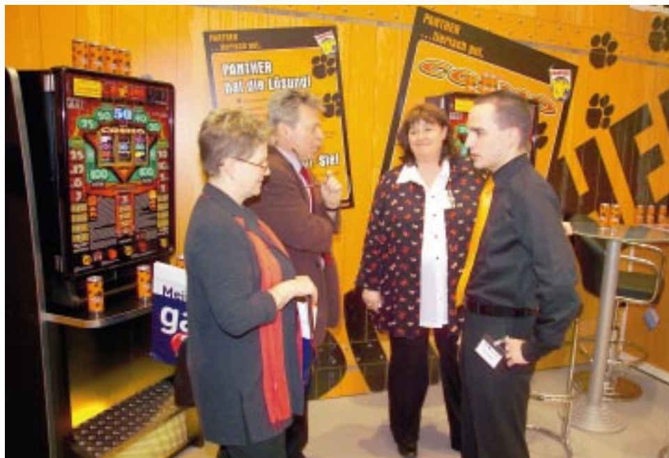
Trendiges Design und gute Beratung lockte die Kunden auf der IMA.